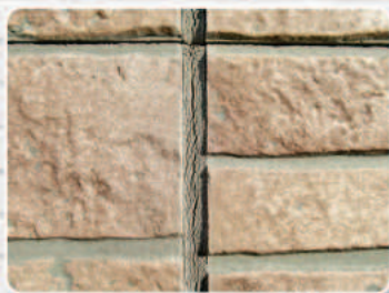
シーリングの劣化