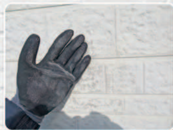
手に白い粉が付く