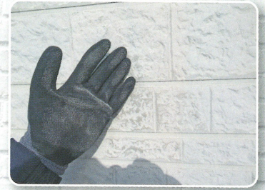
手に白い粉が付く